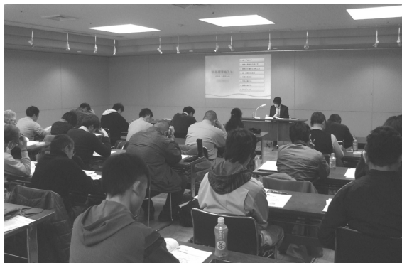
平成29年1月29日 高山市での施工講習会

た基準に合致しているかをチェックする「仕様ルート」と、外皮面積を計算しない「簡易計算ルート」について勉強してもらうものです。詳細計算ではないため、結果の数値は、多少安全側の数値になるとはいえ、顧客との打ち合わせ等での説明などには、役立つ知識になると思われまますので、ぜひ受講してください。